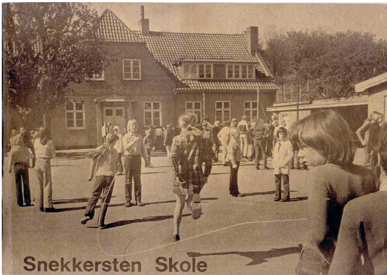
Snekkersten Skole i 1963