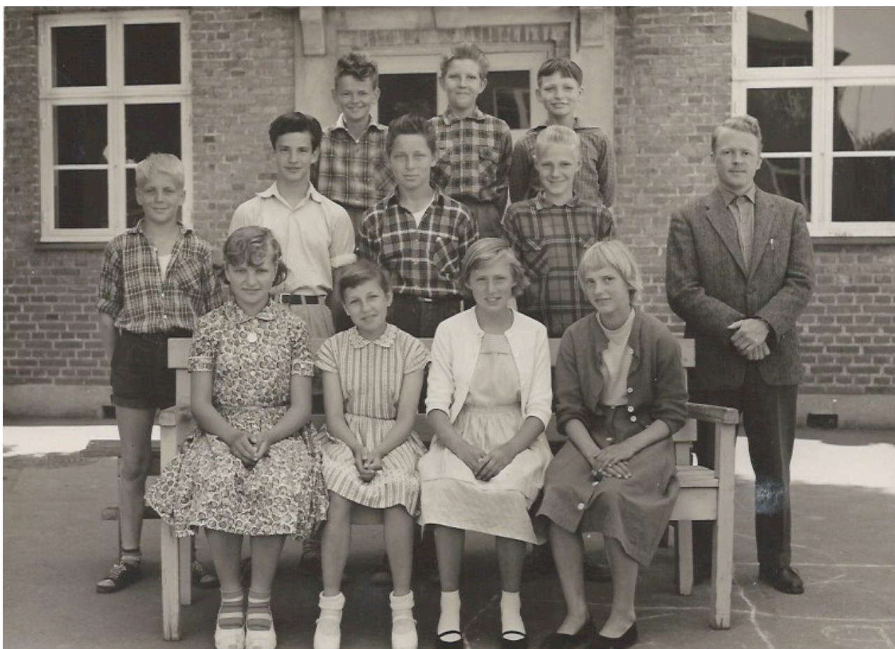
syvende klasse i 1958