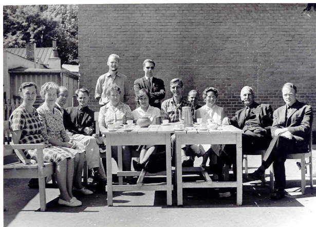
Lærerne i skolegården

I den tid på året, hvor vejret tillod det, sad lærerne i frikvarterene ved et bord foran trappen ned til fyrkælderens og vinduerne til skolekøkkenet, dette lagde lidt af en dæmper på udfoldelsen i frikvarterene, idet man så skulle holde øje med både gårdvagten og lærerne ved bordet. Faktisk synes jeg at kunne huske, at der altid gik en lærer rund i gården, selvom det vel ville have været naturligt, at de alle sad ved bordet.